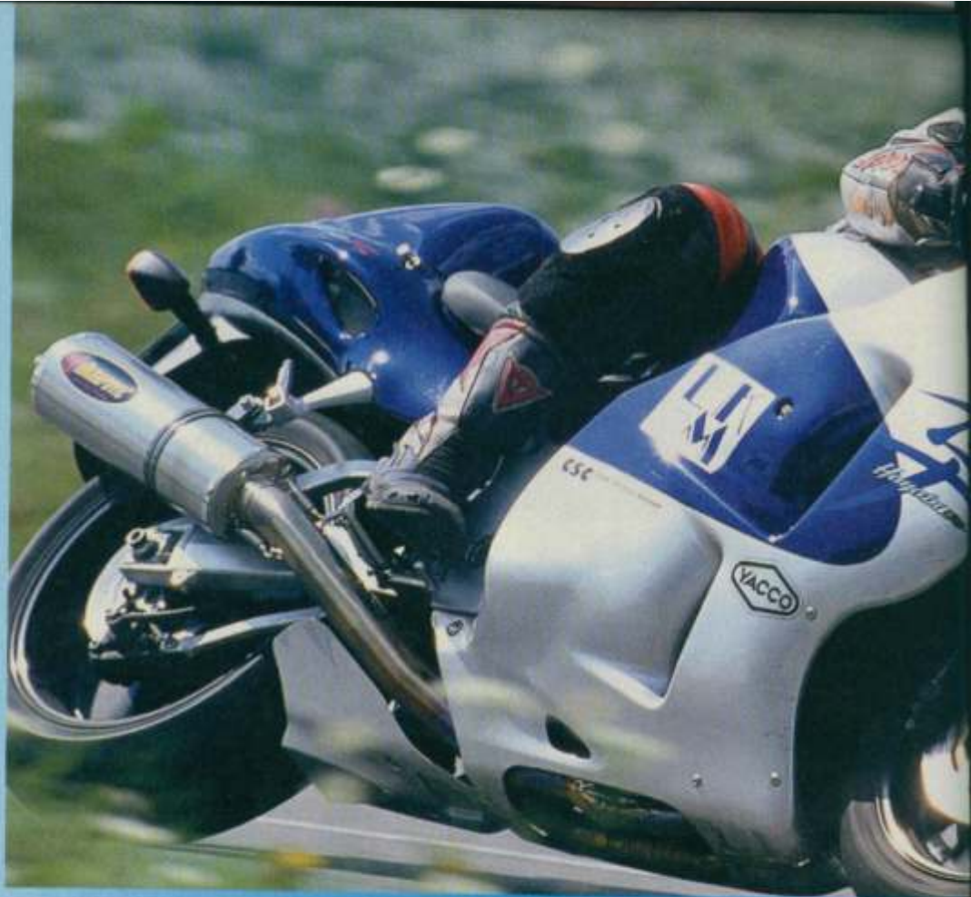
Mörder-Wolf im Schafspelz: Unter dem Serienfell lauert das Raubtier

Dafür könnte der Eigner aber getrost seine Rückspiegel beim Gebrauchteilhändler in Zahlung geben. Zumindest auf der Autobahn wird man die Sehhilfen kaum noch brauchen. Nichts, was so auf deutschen Straßen herumturnt, ist auch nur ansatzweise in der Lage, der LKM-Hayabusa beim Be-