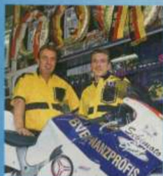
Auf der Rennstrecke konnte die Firma LKM in 17 Jahren mehr als 200 Siege feiern